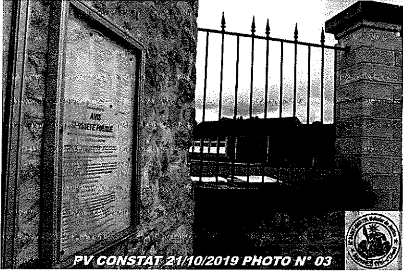
PV CONSTAT 21/10/2019 PHOTO N° 03