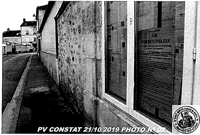
PV CONSTAT 21/10/2019 PHOTO N° 02