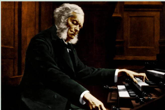
César Franck (1822-1890)

Tous les rendez-vous sont gratuits Ouverture des portes 30 min avant les spectacles